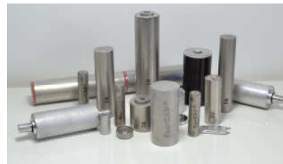
High Temperature Ultracapacitor