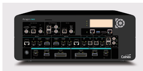
最新製品の 5G 向け時刻同期解析装置「Paragon-NEO」

時刻同期については IEEE 1588V2 規格が定義され、通信や放送など分野別のパラメータ、プロファイルを各組織が定義している。「放送系の規格は SMPTE が規定しています。通信系は ITU-T、オーディオ系は AES、工業系は