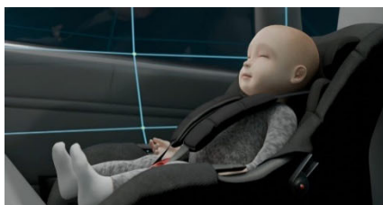
子どもの車内置き去り検知