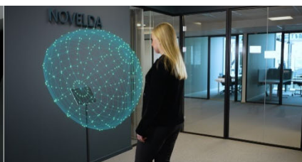
入口における非接触での人物検知