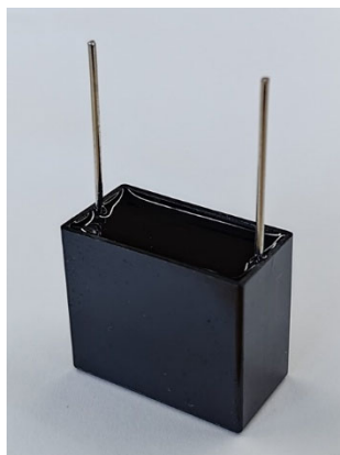
タイツウ社製品 （左）DIPタイプ品 （右）樹脂ケース品