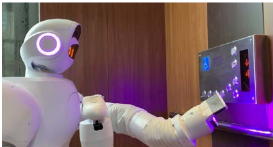
紫外線消毒作業イメージ

日本で最多の施設数を誇り、さらなる事業拡大を目指す学研グループへの本格導入は、当社とアイオロス社にとり、社会貢献度の高い事業となります。今回の取り組み事例を踏まえ、介護施設向けにロボット導入を加速させることにより、介護業界全体での生産性向上や業務効率改善を目指してまいります。